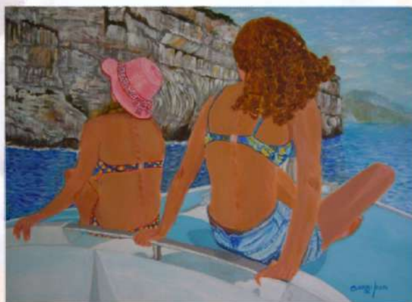
Gita in barca - 2015, acrilico su tela (high profile) 80 x 60 h cm

il piacere di interessare un pubblico raffinato. L'amata Sardegna e le sue genti con il grande sole che tutto avvolge nell'attesa di un carnevale gioioso dipinto negli occhi splendidi tranquilli di una fanciulla. Così una nota positiva voluta in tempo di pandemia nell'arte di Caroggi.