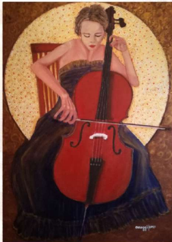
Saggio di violoncello. Anno 2017, acrilico su tela (high profile) 70 x 100 h cm

Si parte dagli occhi per apprezzare i volti e le belle figure dipinte da Caroggi. Giovani donne, in genere, dal viso incantato, dal corpo impegnato, che eseguono un lavoro, che inseguono un sogno. Un mondo non facile a comprendere, ecco perchè l'artista parte con gli occhi, cui è affidato il compito di esprimere gioie e tristezze, incanti ed ansie. Nè sono da trascurare i particolari. Le rifiniture sono dedicate all'abbigliamento che ci indica i tempi: tempo di carnevale, tempo di vacanza, tempo di musica. C'è la trina, l'ampio pannello, la crinolina e il bianco della stoffa. Ed i colori, in cui si ritrova l'amata Sardegna, con quei mari azzurri intensi, i rossi calibrati su di una luce sempre intensamente presente. Caroggi punta sulla figura femminile e sullo sguardo. Non ci sono languori nè incertezze, c'è la sicurezza della bontà ed