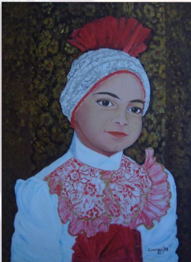
Bambina in maschera. Anno 1988, acrilico su tela, 50 x 70 h cm

il piacere di interessare un pubblico raffinato. L'amata Sardegna e le sue genti con il grande sole che tutto avvolge nell'attesa di un carnevale gioioso dipinto negli occhi splendidi tranquilli di una fanciulla. Così una nota positiva voluta in tempo di pandemia nell'arte di Caroggi.