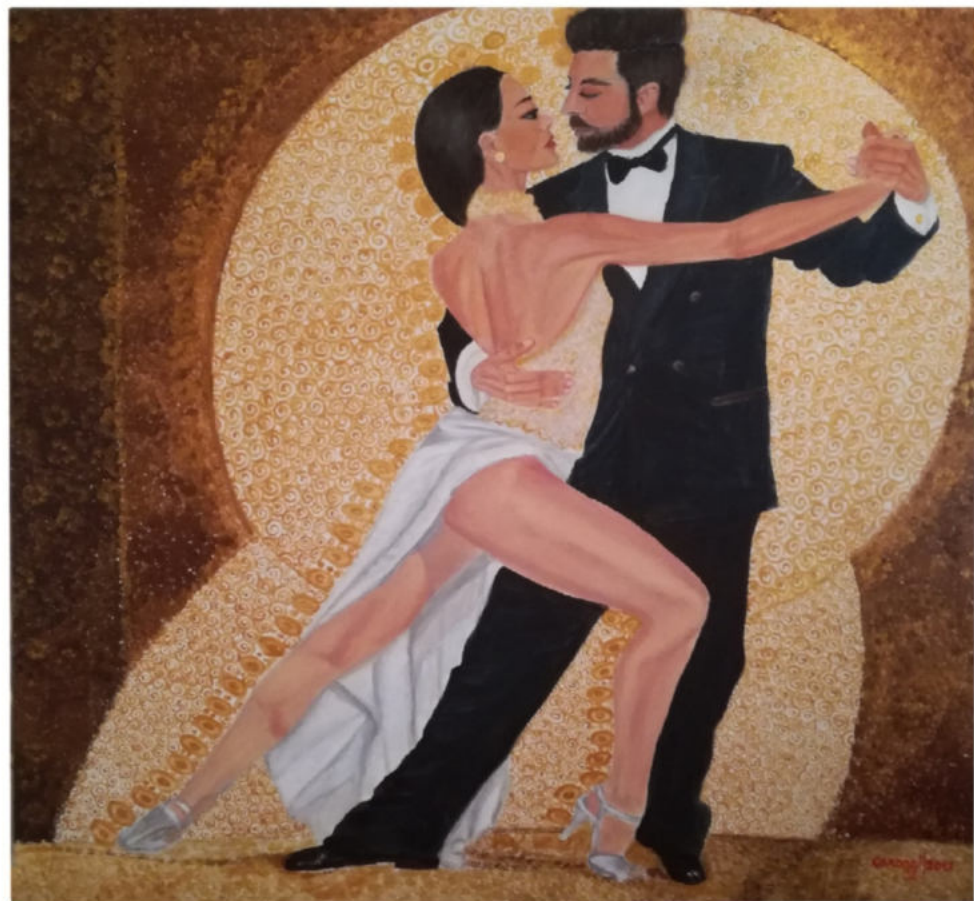
CARMELA OGGIANU 'CAROGGI' 'Tango argentino' Acrilico su tela, cm 100x100, 2017