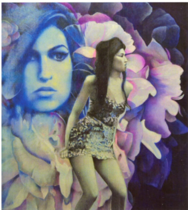
Paolo Cau Back to black, 2015 tecnica mista, 100x90