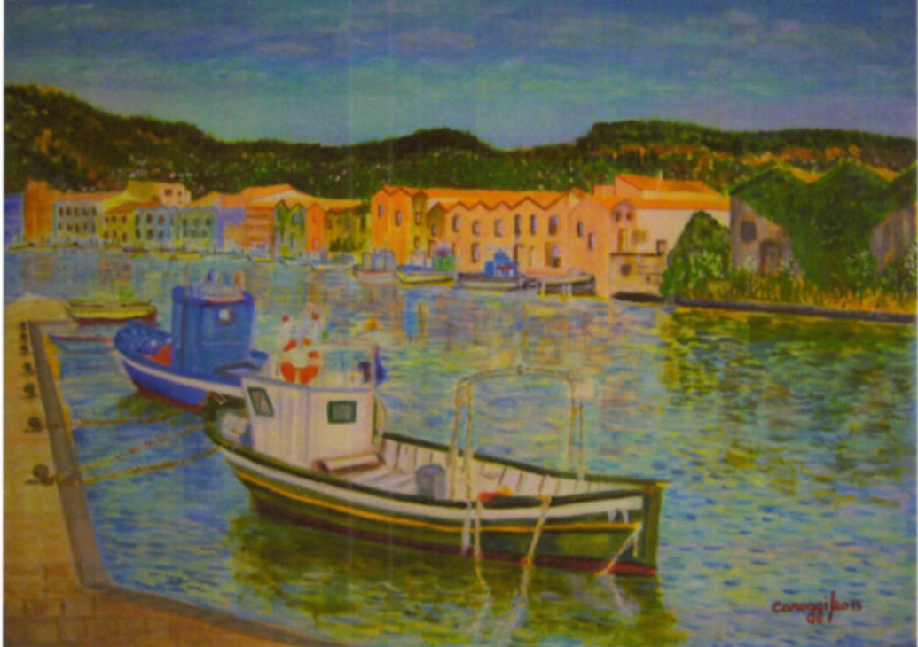
Caroggi Barche da pesca sul Terno, 2015 acrilico su tela, 60x80