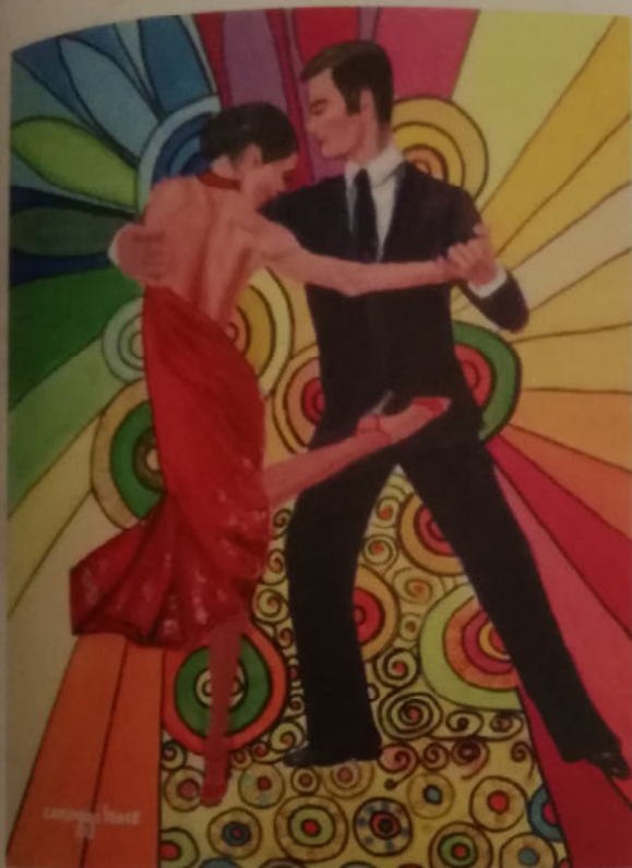
Tango fantasy. Acrilico su tela cm. 40X50. Anno 2018

In un delicato figurativo le opere di Caroggi vanno dalla Natura morta alle scene di vita in un alternarsi trionfale di colori e di segni. I colori squillano accentuando l'idea del movimento, del bello, della natura e le figure lasciano trasparire la loro anima, la loro essenza, fissate in una coreografia sportiva o di animazione infinita, sino ad apparire scena sociale che la suggestione dell'arte immortala all'infinito. Ai colori, fra cui i rossi abbondantemente usati, fanno da contraccampo le variazioni luminose delle acque o degli interni, in una atmosfera colorata in cui l'arabesco prelude alla ricerca percettiva, e le figure compaiono quali attori di un palcoscenico avvincente che è la vita, dipinta come è: gioia o dolore. Realtà e immaginazione si integrano nella pittura di Caroggi.